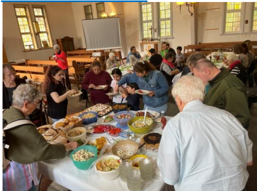
Es ist angerichtet